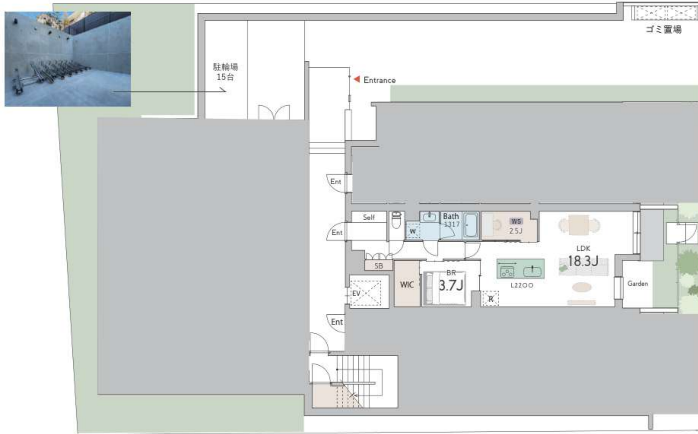
B1F 1LDK×1 / 1SLDK×2

「各住戸約 60 m 2 前後の空間」 + 「オープンキッチン」を合わせた開放的なLDK。 収納またはワークスペースとしても利用できる空間（WS）も設け、多種多様な暮らし方が可能です。