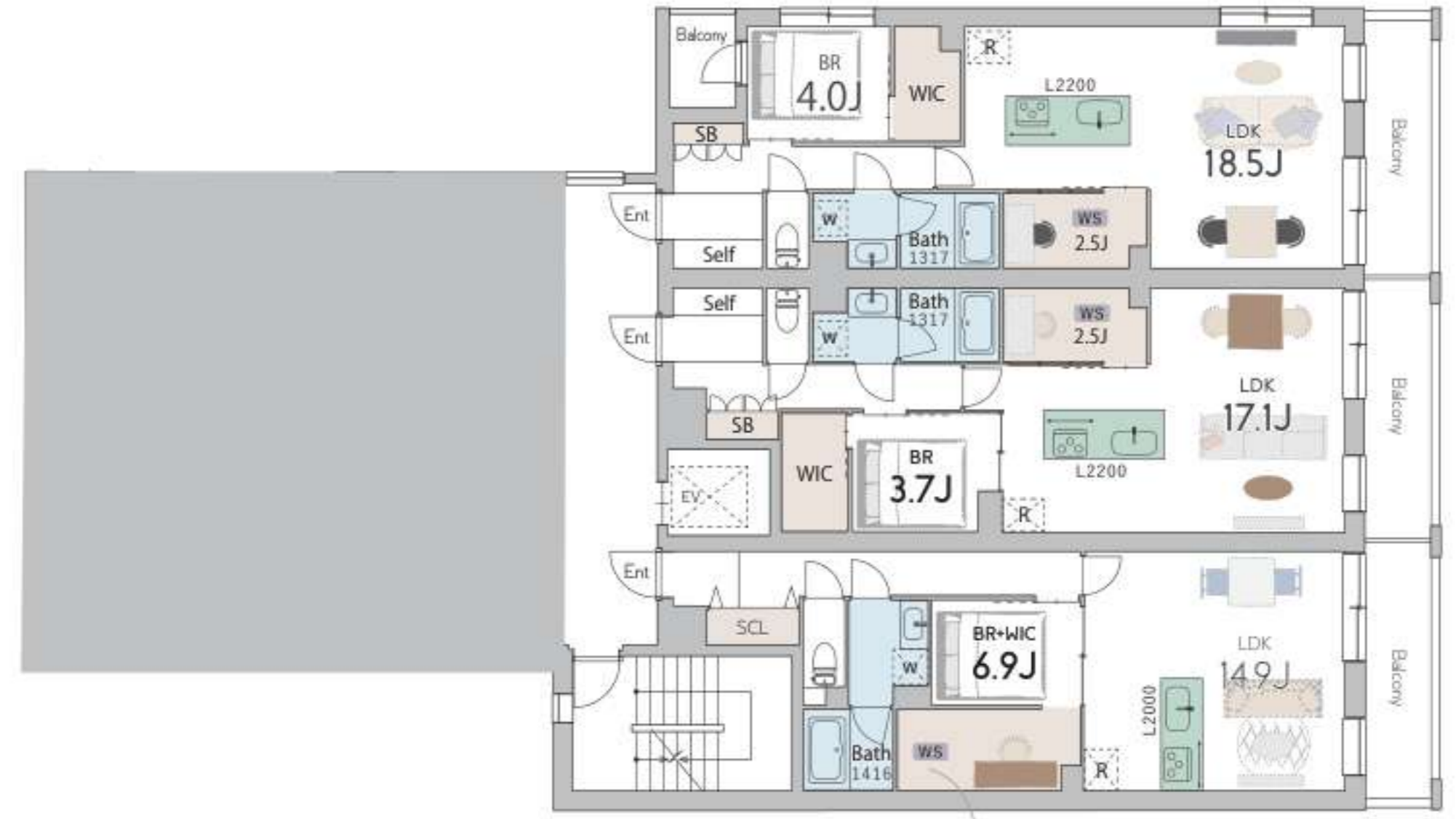
1F 1LDK×1 / 1SLDK×2 / 3LDK×2 ※メゾネットタイプ