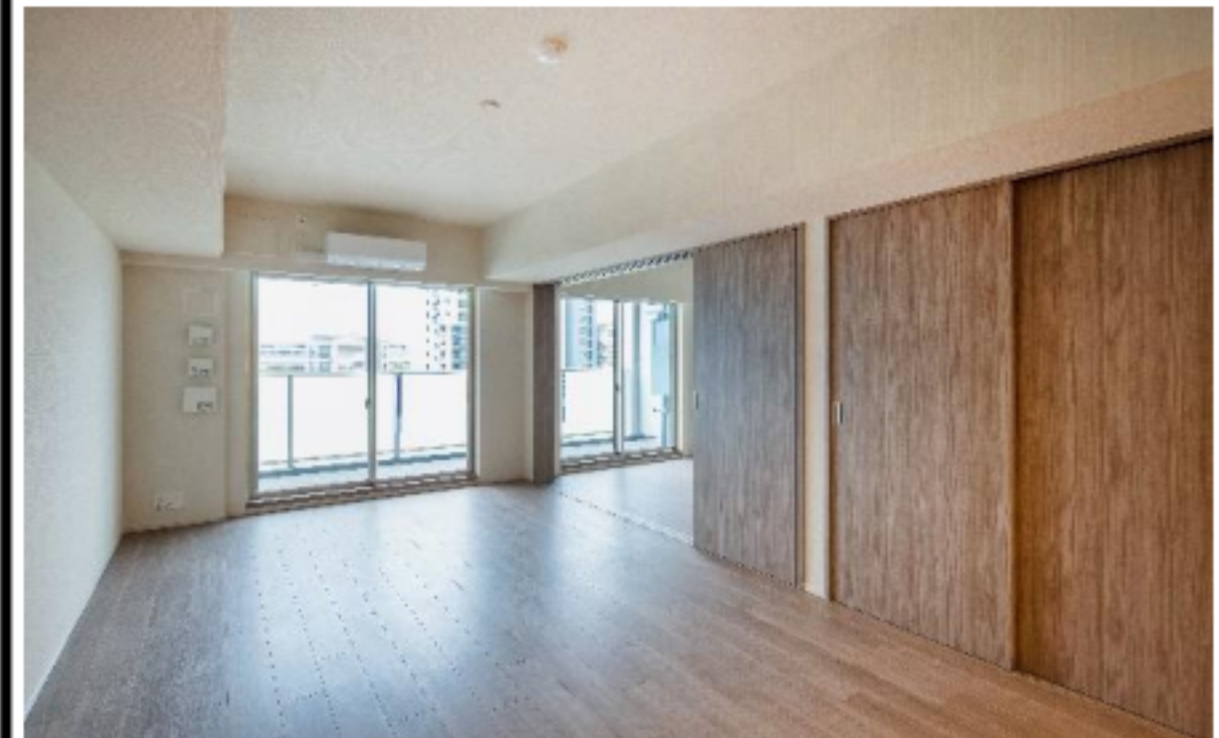
※写真は同タイプ別のお部屋になります。