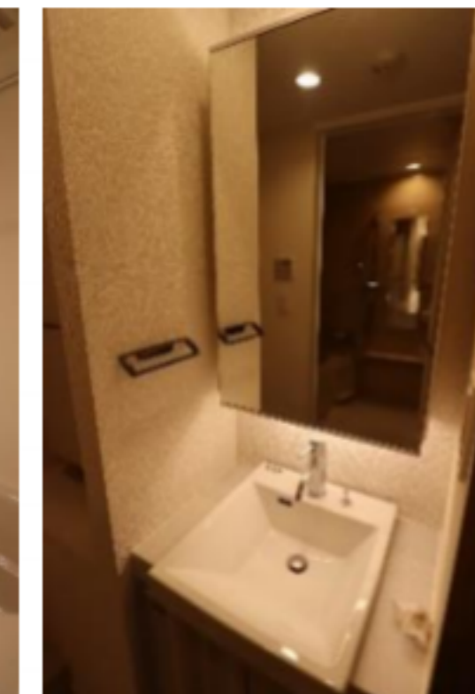
★別タイプ参考写真