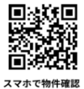
スマホで物件確認