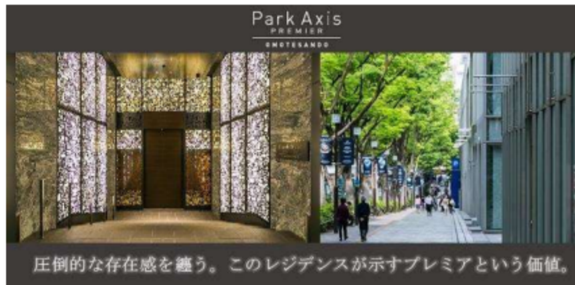
圧倒的な存在感を纏う。このレジデンスが示すプレミアという価値。