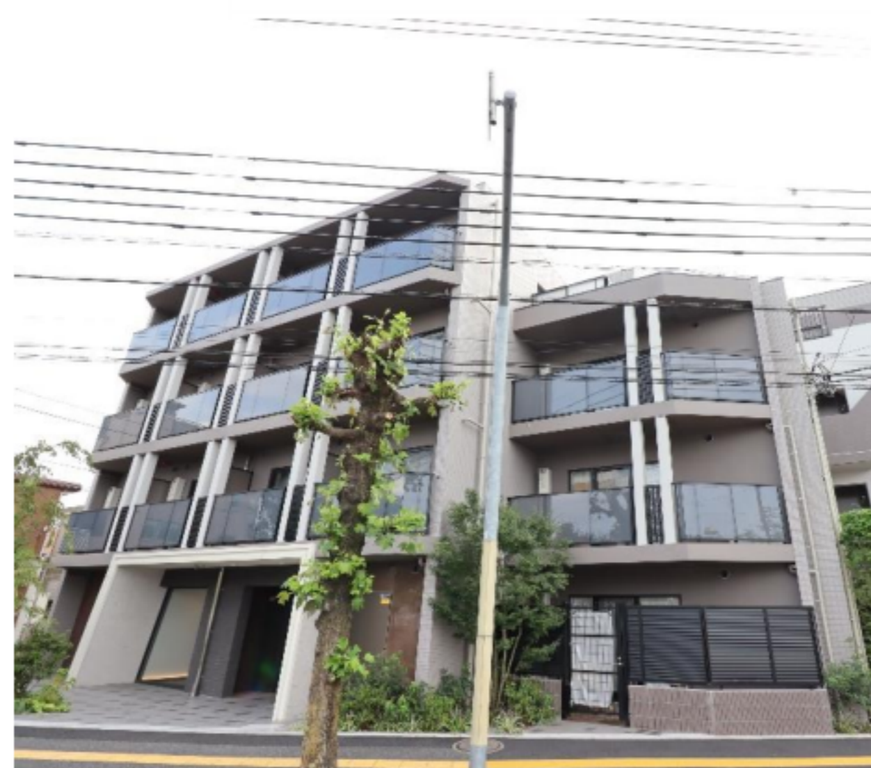
★別タイプ参考写真