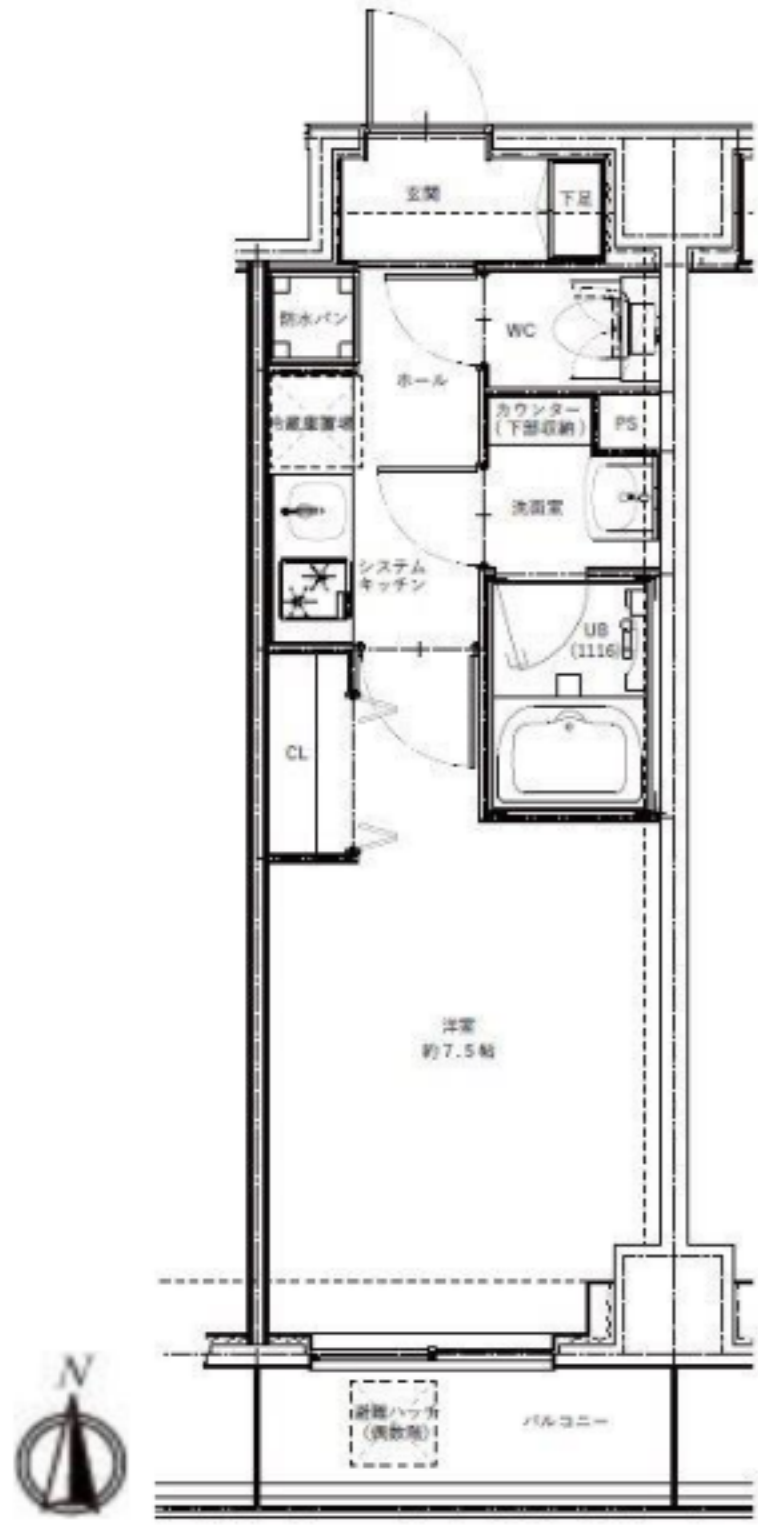
★室内写真反転タイプ

交通 東京メトロ日比谷線「南千住」駅 徒歩 8分 常磐線「南千住」駅 徒歩 8分 都電荒川線「三ノ輪橋」駅 徒歩 13分