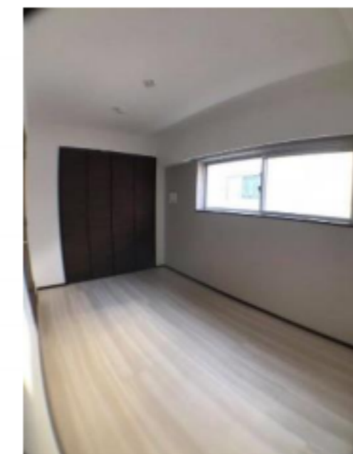
★室内写真あります！転用OK！承諾不要！ https://bit.ly/31Xpg3I