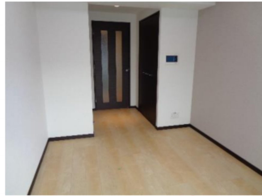
★写真は別タイプ参照