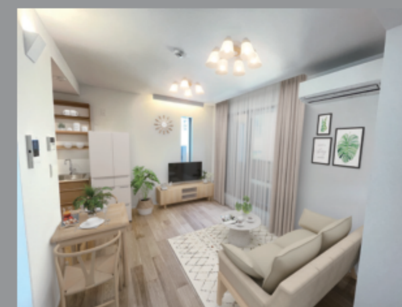
居室 (写真の家具はイメージです)