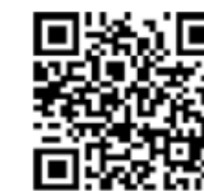
スマホで物件確認