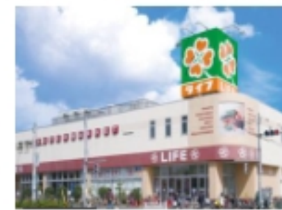
●ライフ六町駅前店

【物件概要】 ●所在地/東京都足立区南花畑3-6-11 ●建物名称/サザンフロント六町 ●交通/つくばエクスプレス線「六町」駅徒歩10分 ●構造/木造3階建 ●完成/2018年7月 ●契約形態/普通借家契約 ●契約期間/2年間 ●中途解約/可(1ヶ月前通知) ●その他/ペット可(猫2匹まで 犬は不可)、2人入居可 【設備概要】 インターネット(1Gbps)使用料無料/オートロック/宅配ボックス/独立洗面台/エアコン/フローリング/照明(居室)/バストイレ別/システムキッチン(ガスコンロ設置済)/室内洗濯機置場/温水洗浄便座/カラーモニター付きインターホン/浴室乾燥機/シューズボックス/玄関ダブルロック/ディンプルキー/敷地内ゴミ置き場/駐輪スペース/プロパンガス(エネアーク関東※保証金15,000円) 【初期費用】 ●敷金0ヶ月/礼金0ヶ月 ※ペット(猫2匹まで)飼育の場合は敷金1ヶ月追加 ●保証料(保証会社必須:ROOM ID)賃料+共益費の50% ※法人契約等の理由により保証会社未加入の場合は敷金1ヶ月になります ●家財保険 加入要:18,000円/2年 ●書類作成費 2,000円(税別) ●鍵交換/25,000円(税別)任意 【その他費用】 ●月額保証料/賃料+共益費の1% ●更新料/新賃料の1ヶ月分 ●退去時ルームクリーニング費用 1LDK70,000円(税別) ※支払は解約時 ●短期解約違約金/1年以内の解約・賃料の2ヶ月分/2年以内の解約・賃料の1ヶ月分 【申込方法】『内見予約くん』で申込書式を取得し、①記入済申込書 ②運転免許証またはパスポート ③健康保険証または内定通知書④源泉徴収票 ⑤申込時確認事項の5点を下記宛にメール ※内見前のお申込みは先行契約になります ※掲載写真は2018年8月撮影