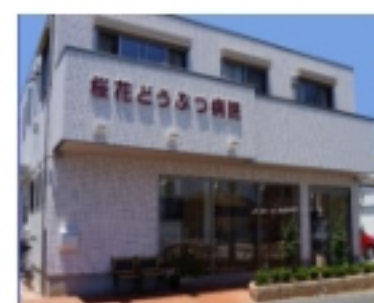
●桜花動物病院180m(徒歩2分)