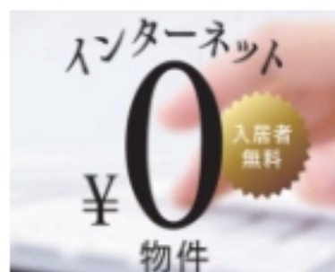
●インターネット入居者無料