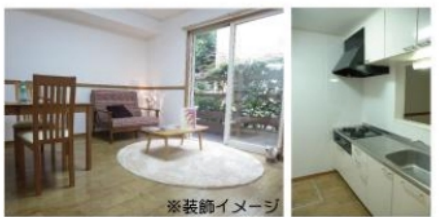
※装飾イメージ ※現況と異なる場合は、現況優先とします。