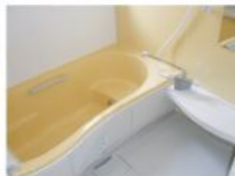
※写真は別のお部屋です。