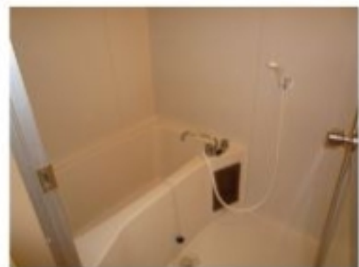
※他の部屋の写真です。