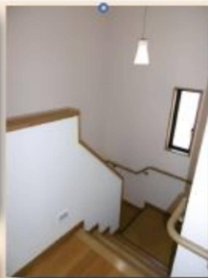
▲戸建感覚のテラスハウス