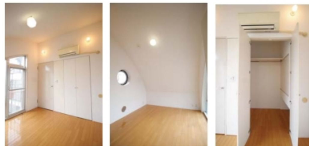
※他の部屋の室内写真です。