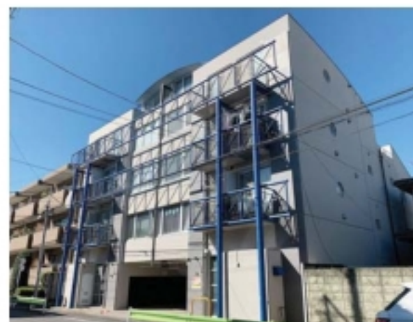
※図面と現況が異なる場合は現況を優先します。