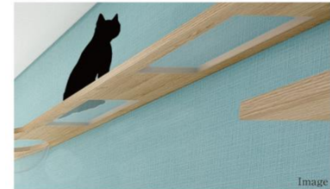
B キャットウォーク・キャットステップ

壁紙と床 (CFシート) は傷がつきにくくペットにも優しい素材を採用。室内の痛みや汚れを軽減します。