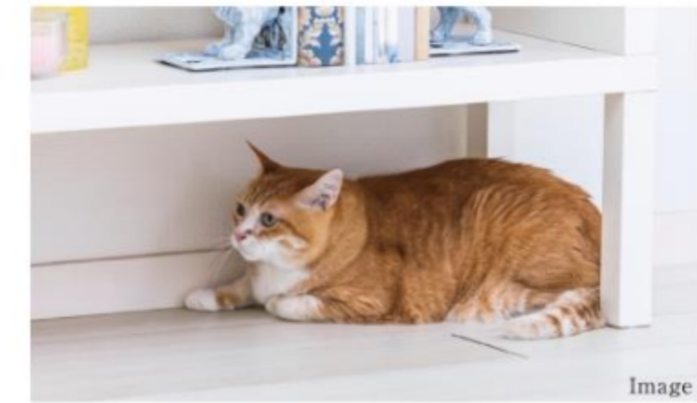
A 壁紙・床 (CFシート)

壁紙と床 (CFシート) は傷がつきにくくペットにも優しい素材を採用。室内の痛みや汚れを軽減します。