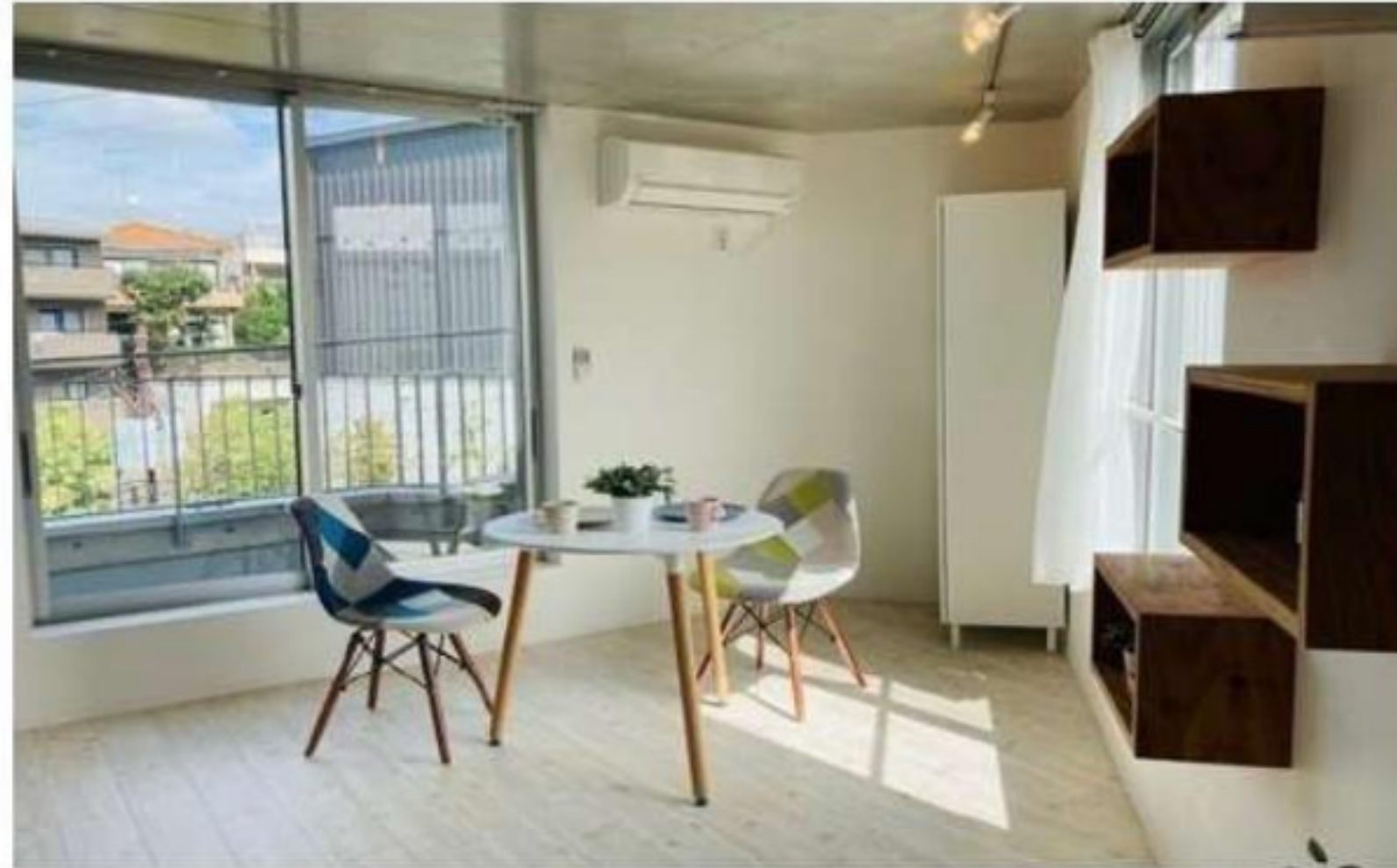
家具はついておりません