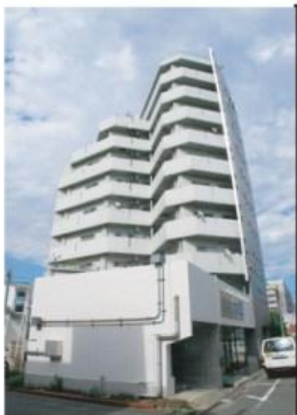
スタイリッシュなタイル貼りの外観