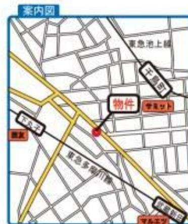
3駅利用可能な好立地

2線(東急多摩川・東急池上) 3駅(下丸子・武蔵新田・千鳥町) 利用可能 近隣にスーパー (西友・サミット・オリンピック) 育児所・保育園・託児所多数 区民プラザ・児童館至近