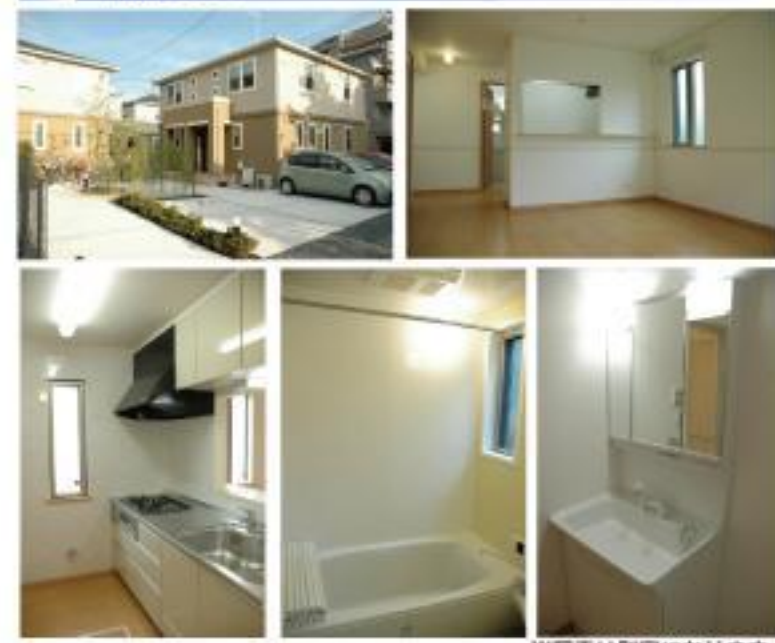
※写真は別室になります。