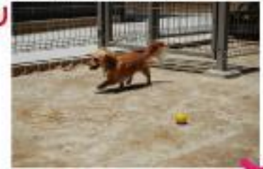
愛犬と遊べるドッグラン