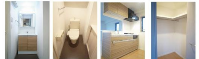
※イメージ写真になります