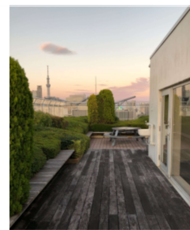
屋上スカイデッキ ※開放時間に制限がございます。 ご利用の際は使用細則を遵守ください。