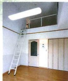
ロフトが付いた広い部屋