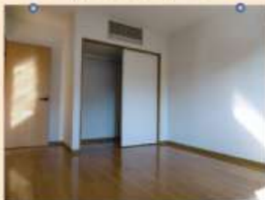
▲2階に3室。各室に収納あり！