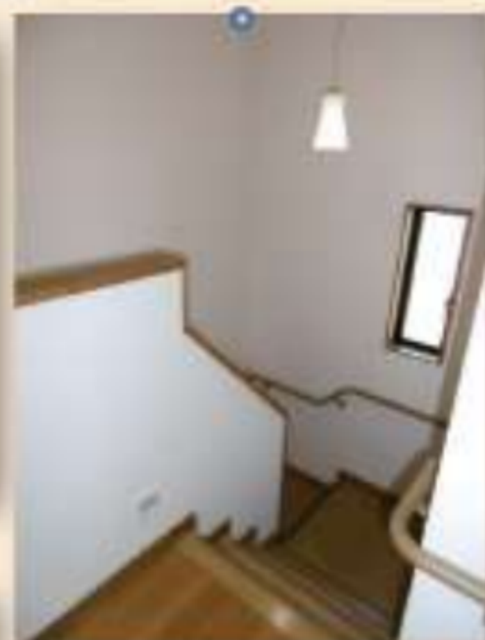
▲戸建感覚のテラスハウス