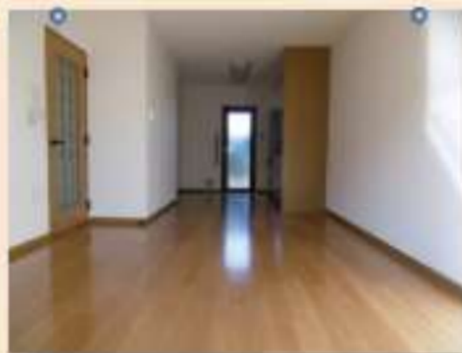
▲12.5帖のリビングダイニング